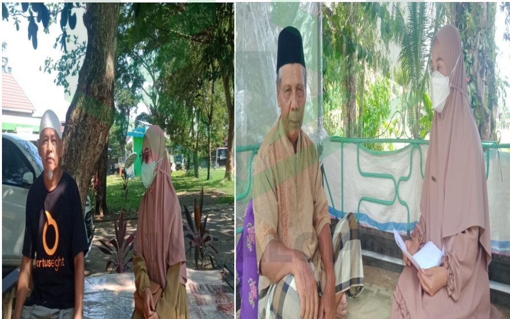
Wawancara dilakukan dengan orang tua dan tokoh masyarakat