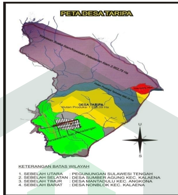
Gambar 2.2. Peta Desa Taripa

terutama sector industri kecil yang bergerak di bidang perdagangan dan pemamfaatan hasil olahan pertanian dan perkebunan.