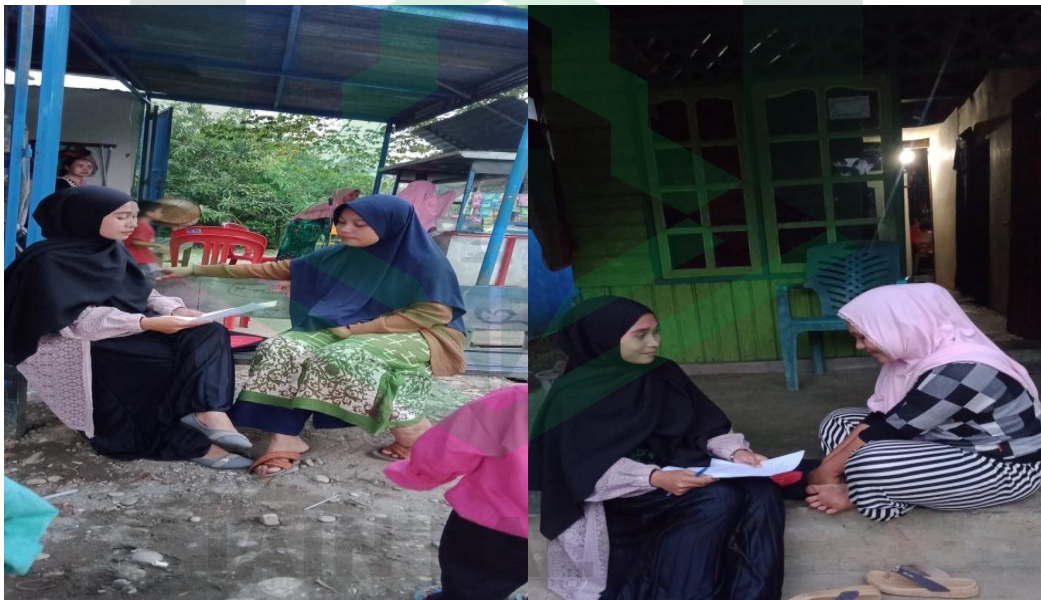
Wawancara dilakukan dengan pelaku pernikahan dini