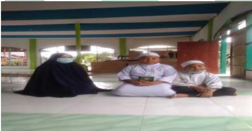
Wawancara dengan Santri PonPes Modern Al-Zakiyah Malela Suli