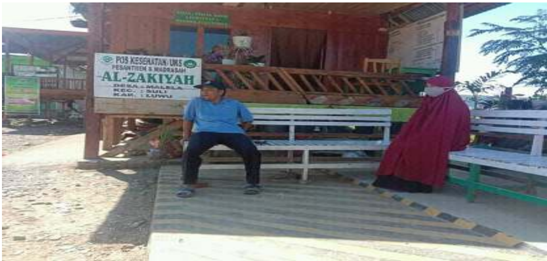
Kepala Madrasah PonPes Modern Al-Zakiyah Malela Suli