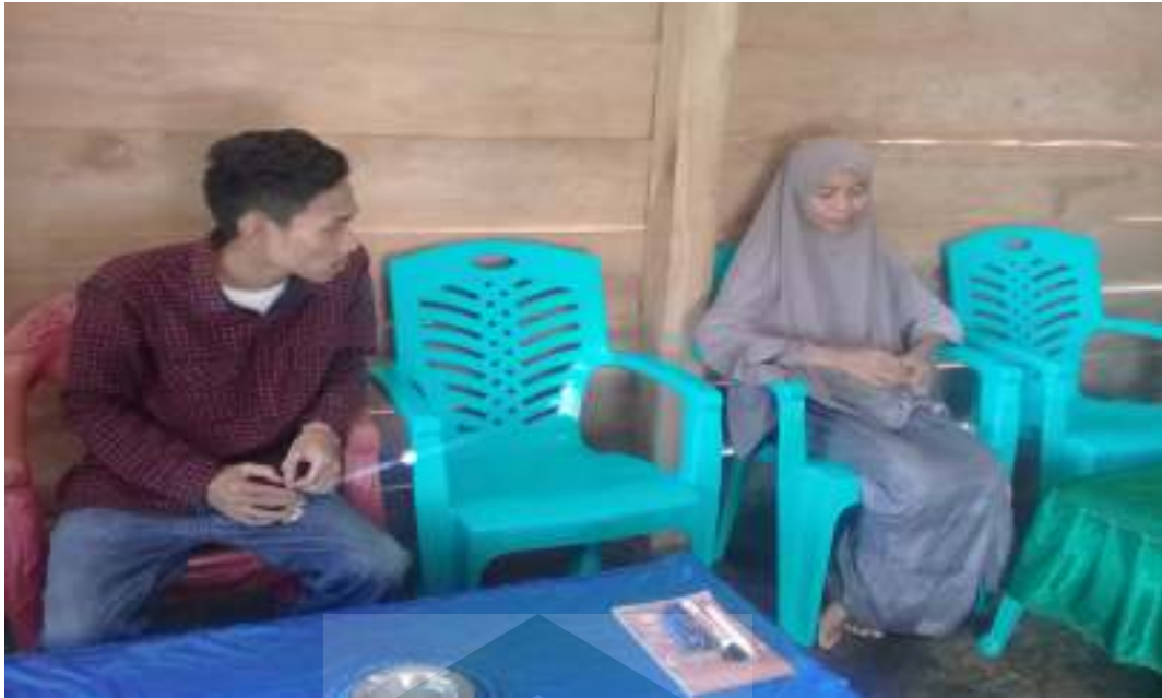
Wawancara dengan kepala dusun Dandang