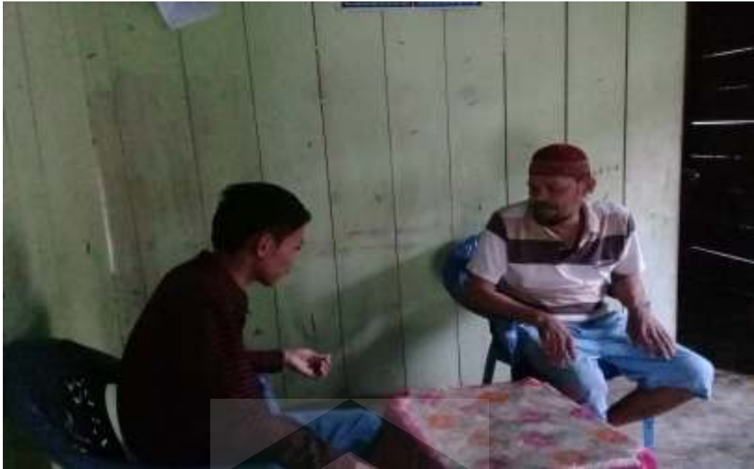
Wawancara dengan masyarakat Desa Dandang