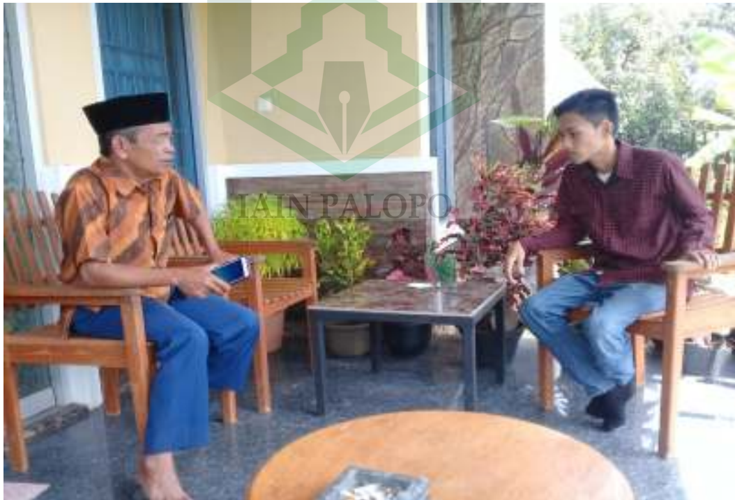
Wawancara dengan kepala Desa Dandang