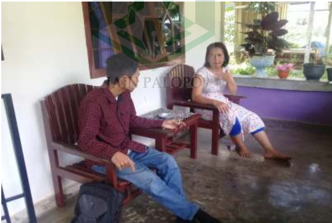
Wawancara dengan kepala Desa Duangin