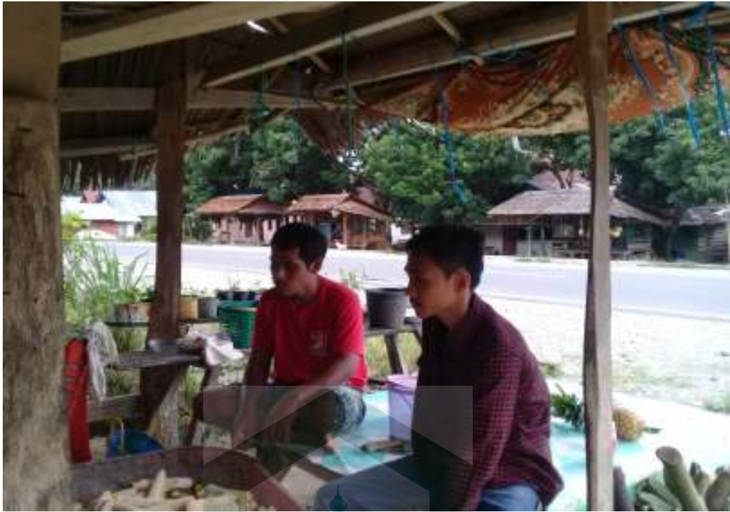
Wawancara dengan masyarakat Desa Buangin