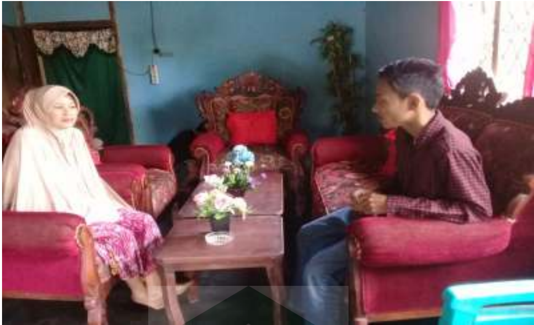
Wawancara dengan masyarakat Desa Dandang