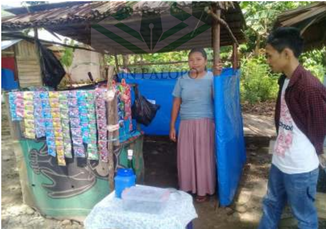
Wawancara dengan masyarakat Desa Buangin