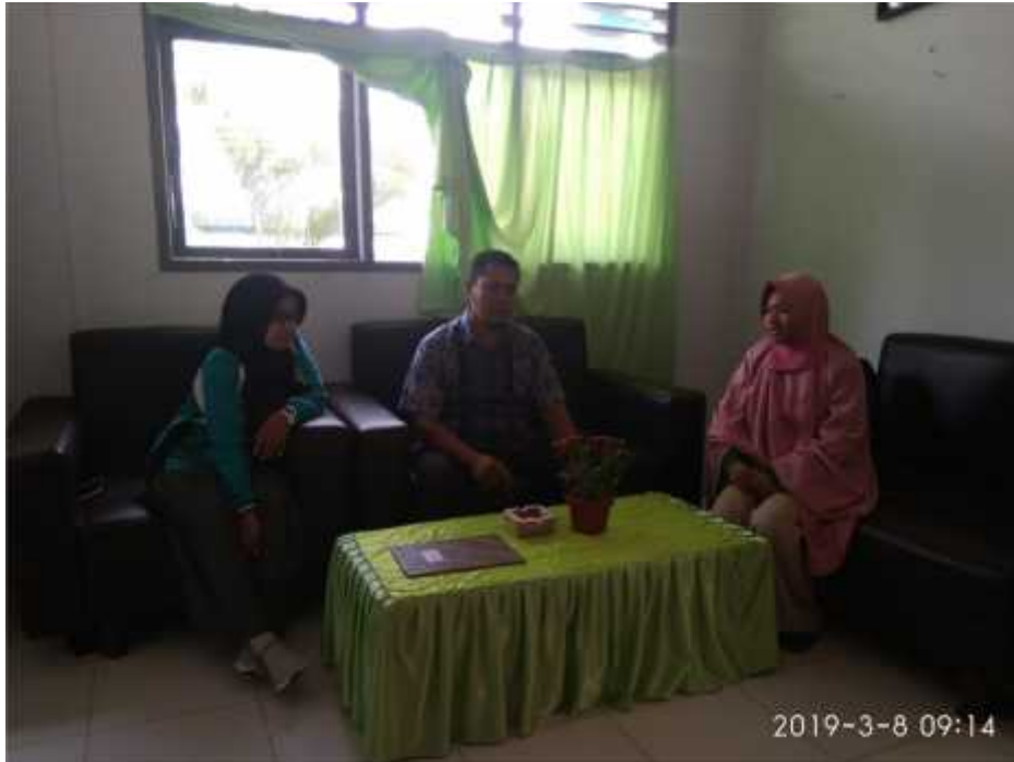
FOTO KEGIATAN MELAKUKAN WAWANCARA PADA KEPALA SEKOLAH DENGAN GURU AGAMA ISLAM