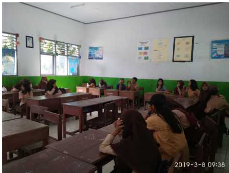
Gambar di atas adalah proses pembagian angket di kelas VIII