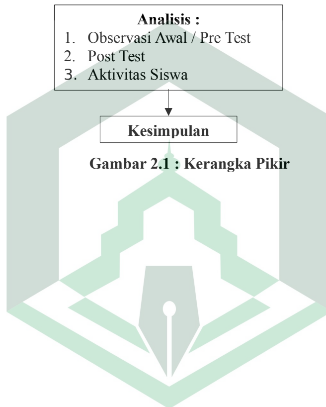
Gambar 2.1 : Kerangka Pikir