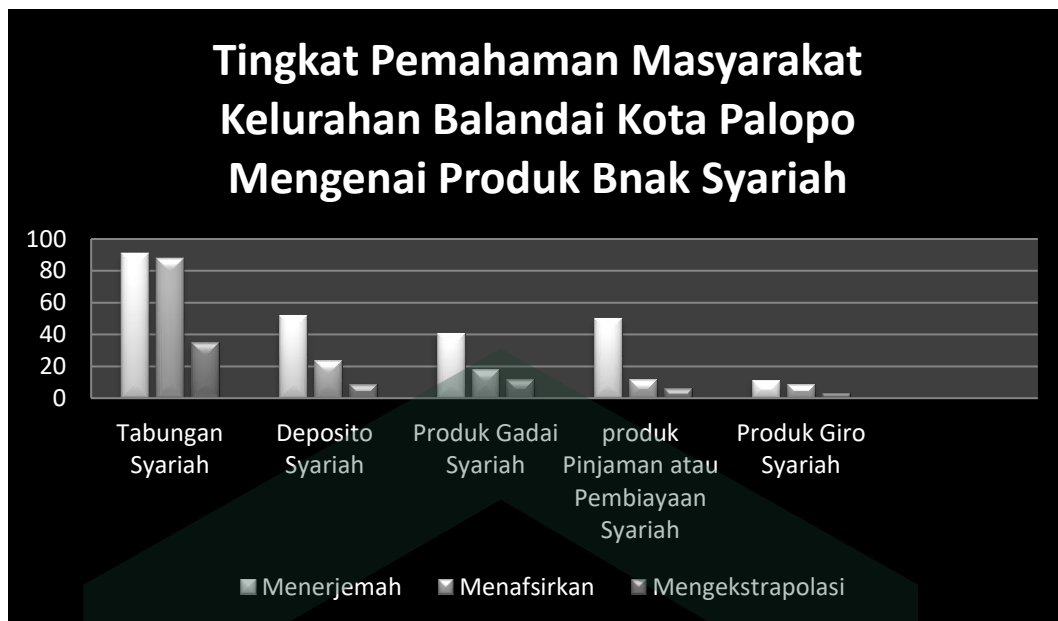
Gambar 4.2 Grafik Tingkat Pemahaman Mahasiswa

Berdasarkan grafik diatas dapat dilihat bahwa tingkat pemahaman masyarakat mengenai produk bank syariah kota Palopo masih perlu ditingkatkan dilihat dari kemampuan mereka dalam hal menerjemah, menafsirkan, dan mengekstrapolasi setiap produk bank syariah khususnya yang sering di manfaatkan masyarakat. Dilihat dari jumlah masyarakat yang mampu memberikan defenisinya lebih banyak pada produk tabungan.. Kemudian kurang dari setengah responden yang dapat memberi pemaknaan pada produk lainnya, terutama pada produk giro.