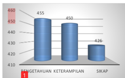
Gambar 1. Hasil Indikator Diklat

Hasil analisis statistika variabel diklat ( X_1 ) diperoleh gambaran karakteristik distribusi skor Diklat yang menunjukkan skor rata-rata adalah 73,33 dan varians sebesar 17,867 dengan standar deviasi sebesar 4,226 dari skor ideal 100, sedangkan rentang skor yang dicapai 11.00, skor terendah 69 dan skor tertinggi 80. Hasil perbandingan untuk setiap indikator yang terdapat pada variabel Diklat dipaparkan sebagai berikut: