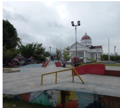
Tempat bermain skateboard