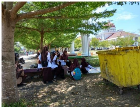
Tempat duduk untuk bersantai