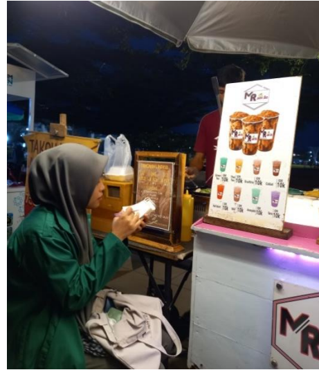
Fasilitas yang terdapat di Lapangan Pancasila