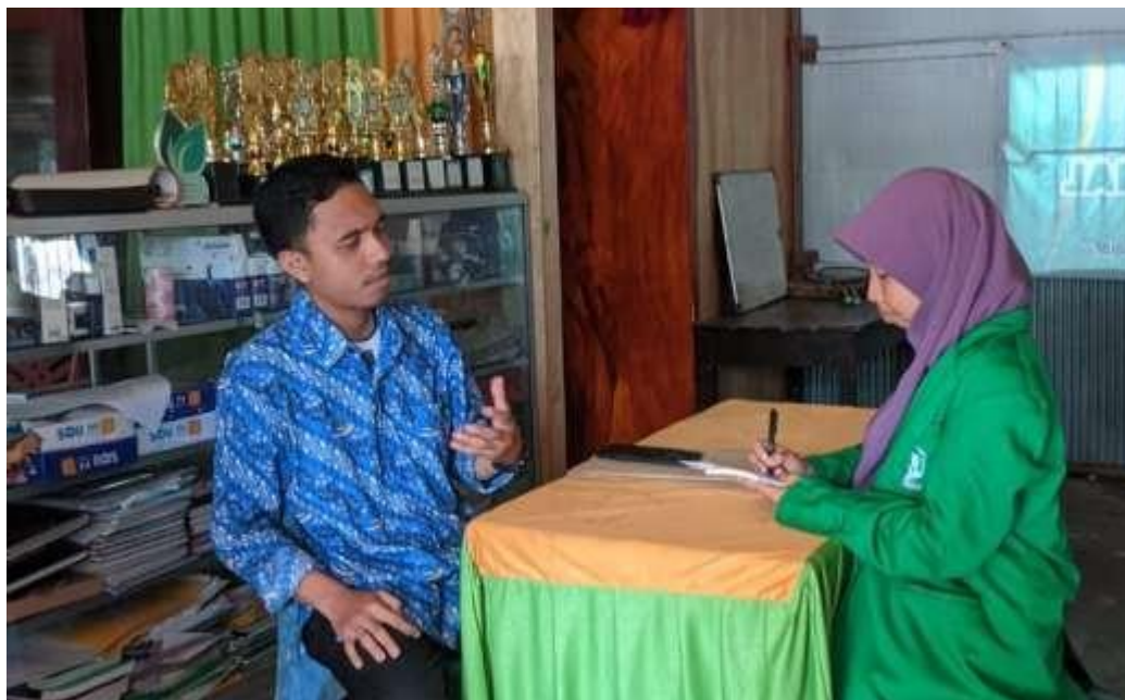
(Foto Kegiatan Wawancara bersama Guru Bahasa Arab SMPIT al- Hafizh)